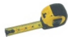
Ruban à mesurer