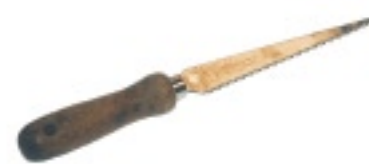
Scie à dents fines

Outils recommandés pour l'installation du PlastiSpan HD