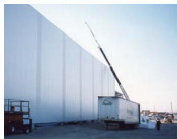
Isolant pour chambre froide