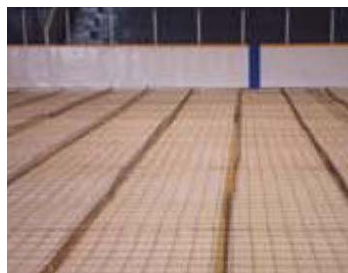
Isolant pour patinoires

2 x 8 pi; 4 x 8 pi; Paquets de 2 pi de hauteur plus dimensions de commandes spéciales Épaisseur visant à satisfaire aux exigences d'utilisation requises